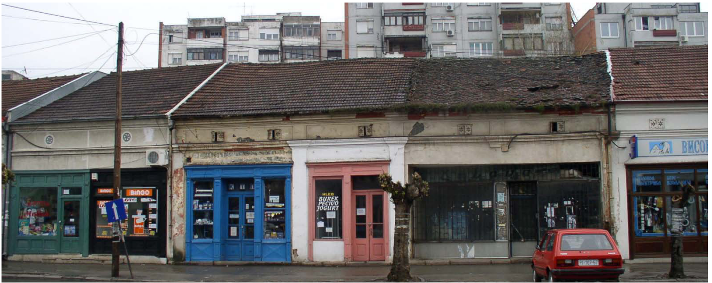
Слика 7. Улични фронт са порталима на Тргу Републике, Ниш