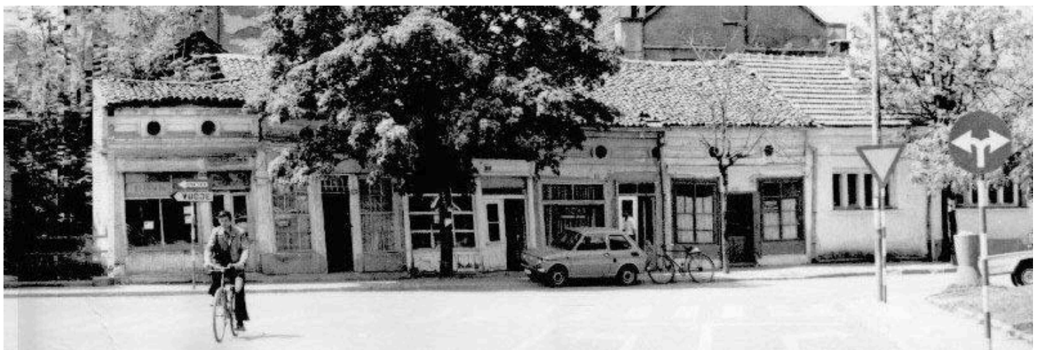
Слика 2. Улични фронт локала у Ул. Пана Ђукоћа, пре рушења, Лесковац