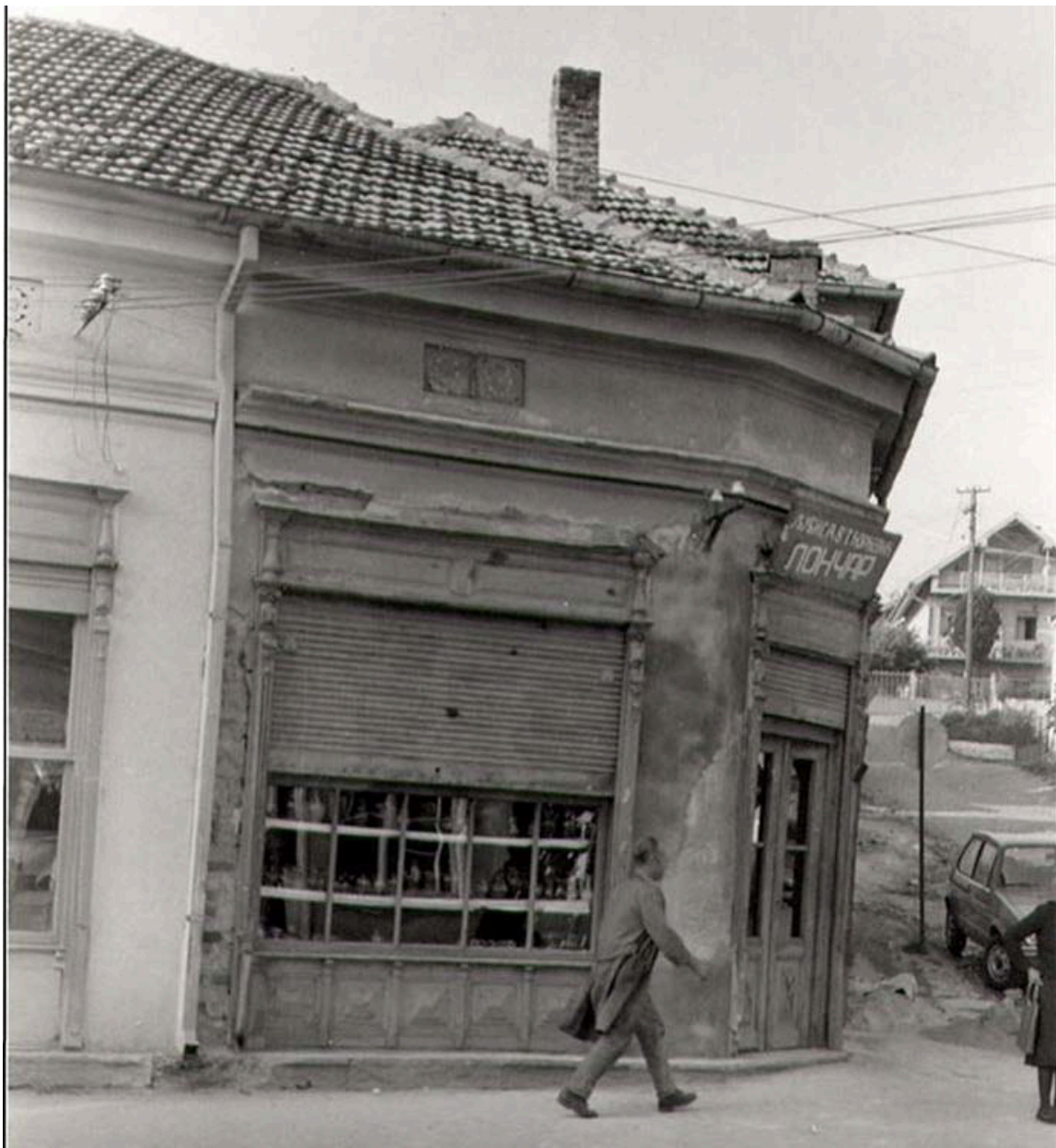
Слика 3. Улична угаона фасада објекта у Ул. Светозара Марковића, Лесковац