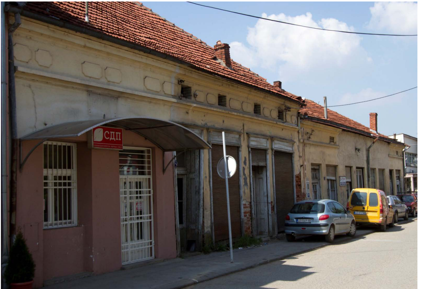
Слика 5. Улична фасада са порталима на објекту у Ул. Бранислава Нушића, Лесковац