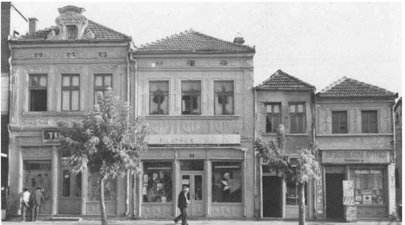
Слика 6. Улични фронт са порталима на Булевару Ослобођења, Лесковац