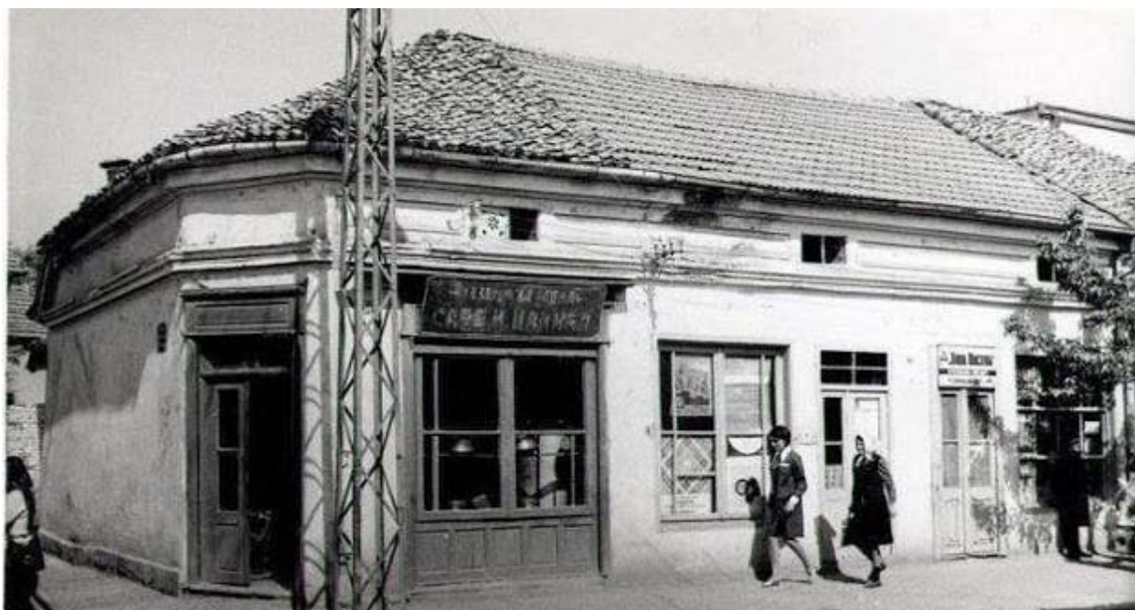
Слика 4. Улична угаона фасада објекта у Ул. Светозара Марковића, Лесковац